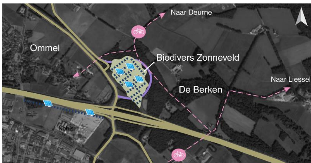
Figuur 2 Schematische weergave van het idee 'biodivers zonnepark'